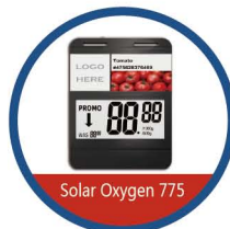
Управление ценами всех магазинов сети по желанию