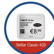
Могут применяться в отделах кулинарии, хлеба, макарон и замороженных продуктов